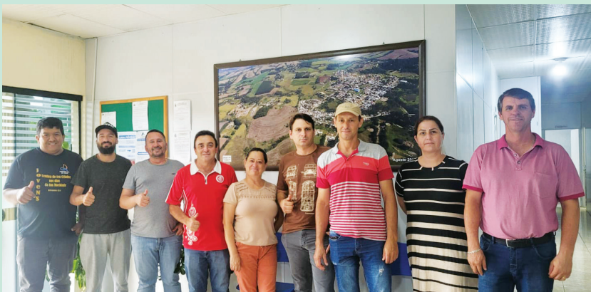
Prefeitura Municipal de Rio Branco do Ivaí