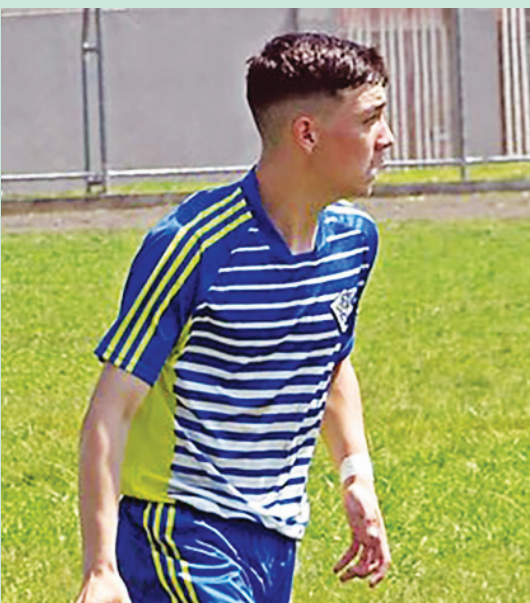
Vini Futsal comemorou aniversário em Faxinal. Parabéns!!