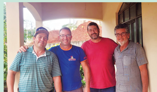
Barriquelo da Cafeeira Grandes Rios com amigos