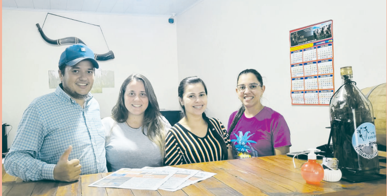
Equipe de trabalho do Leilão de Gado em Rosário do Ivai