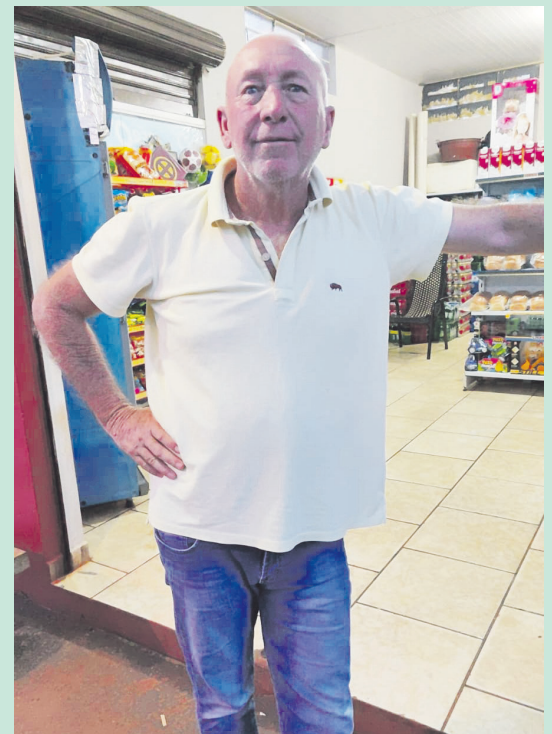
Meu amigo Polaco da Lagoa, vulgo Chá de Uru