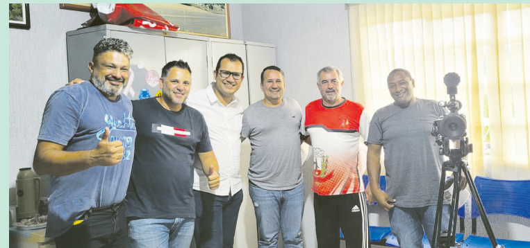
Prefeitura de Rio Branco do Ivaí recebendo membros da imprensa regional